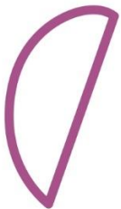
Circuito Baby Max 1